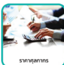
ราคาศุลกากร