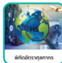
พิกัดอัตราศุลกากร